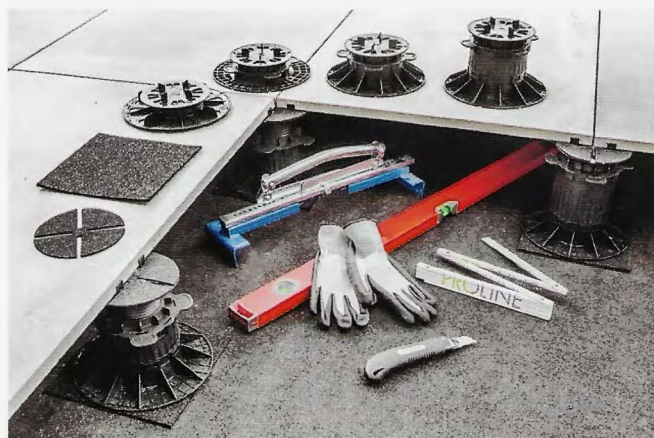
SICHERE VERLEGUNG VON OUTDOOR-KERAMIK UND NATURSTEIN AUF DACHTERRASSEN MIT PROSTILT.