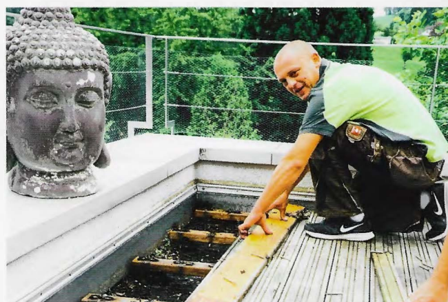
DIE MEIST NICHT MEHR ANSEHNLICHEN TERRASSENDIELEN WERDEN ENTFERNT UND MIT KERAMISCHEN BELÄGEN SANIERT.