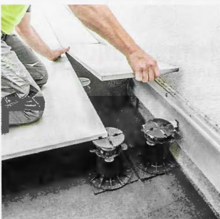
Verlegung des Outdoor-Keramik mit Prostil Stelzfüße und Prostil-Clips

Ein privater Bauherr beschloss, den schlecht gealterten Holzbelag auf seiner 30 m 3 großen Dachterrasse durch 120 x 60 cm große und rund 40 kg schwere XXL-Platten aus Outdoor-Keramik zu ersetzen. Als Unterkonstruktion wählte er das Stelz- und Plattenlager Prostil von Proline (Porträt in Naturstein 2/2018). Eine Beschädigung der abdichtenden Bitumenbahnen wird laut Firma dadurch verhindert, dass die Prostil-Stelzfüße eine »extrem große Standfläche« (Ø 20 cm) haben. Unter den Stelzfüßen platzierte Gummigranulat-Pads mit Aluminiumkaschierung würden zudem das Wandern von Weichmachern von der Bitumenbahn in den Stelzfuß verhindern und gewährleisten, dass die Stelzfüße dauerhaft funktionieren. Im Randbereich der wannenartig abgedichteten Terrasse wurden auf die Oberseite der Stelzfuß-Teller aufgesetzte Prostil-Clips mit Abstandhalter und integralem Neoprenpad angebracht, wodurch sich eine konstante 10 mm breite Fuge