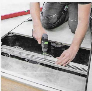
Verlegung des Prostil-Rinnensets nach DIN 18040-2

zur Wand ergab. Damit stellte der Bauherr sicher, dass die Terrassenabdichtung auch bei Flächenbewegungen des Obermaterials keinen Schaden nimmt.